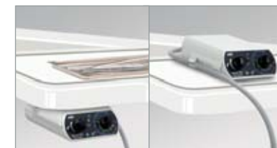
Sobre/Debajo del panel de instrumentos