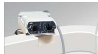
Con Soporte (opcional) sobre el brazo del panel de instrumentos