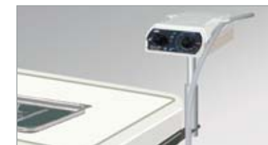
Detrás del panel de instrumentos, con Brazo de Montaje (opcional)