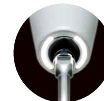
Doble luz LED